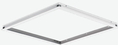
Kits de adaptadores para empotrar