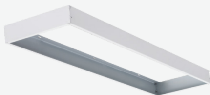
Kits de montaje en superficie