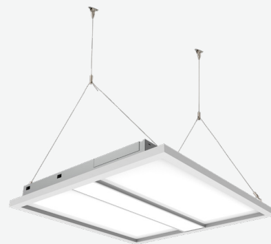
Kits de suspensión